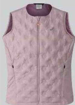
Asics Nagino Run Padded Gilet