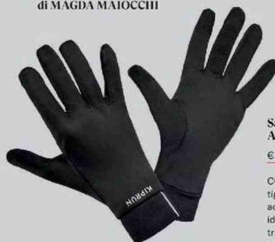
Salomon Sense Aero Stow

MORBIDISSIMO, HA TUTTO quello che serve quando il freddo comincia a farsi sentire davvero. Antivento e impermeabile, è dotato di imbottitura sul davanti, orlo lungo a protezione della schiena, comode tasche laterali e inserti riflettenti.